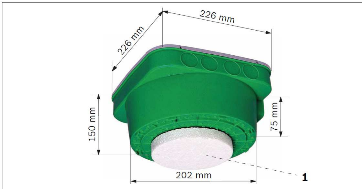
Bild 3.12 FAA-500-CB Einbaugehäuse

FAA-500-CB Einbaugehäuse dienen zum Einbau der Melder der Serie 500 in Betondecken. Sie ermöglichen eine einfache und genaue Positionierung von Kabelkanälen.